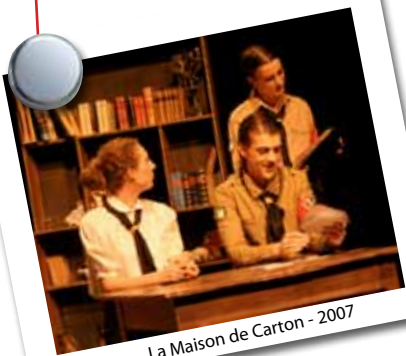
La Maison de Carton - 2007

D 'où vous est venue l'idée d'écrire L'Expérience interdite ?